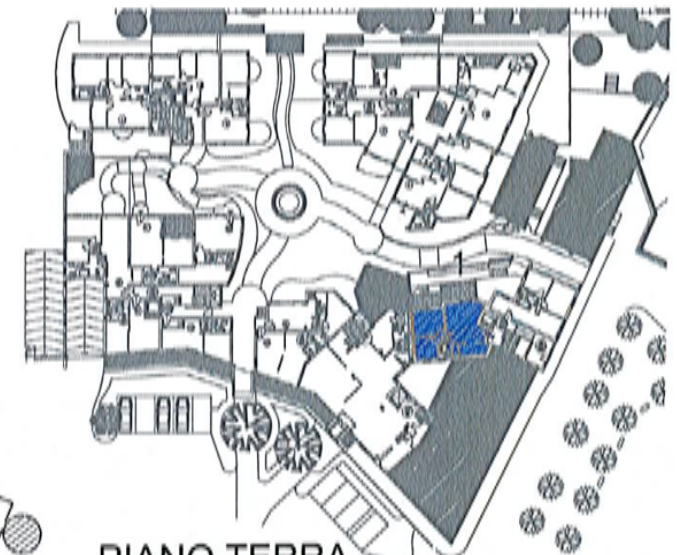
PIANO TERRA (scala 1:1000)