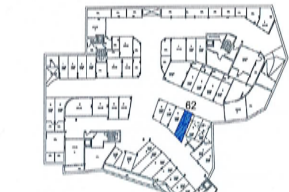
PIANO INTERRATO (scala 1:1000)